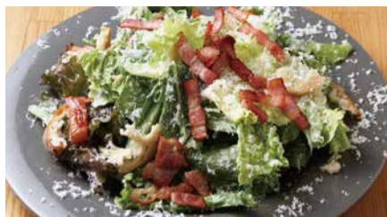
厚切りベーコンのシーザーサラダ 1280 Caesar Salad with Bacon [税込価格1408] [+¥150で半熟卵付にできます!]