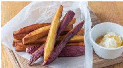
さつま芋スティック 750 蜂蜜バターディップ [税込価格825] Fried Sweet Potato with Honey & Butter