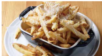
チーズ&ペッパーフレンチフライ 800 トリュフの香り [税込価格880] French Fries with Cheese, Black Pepper and Truffu