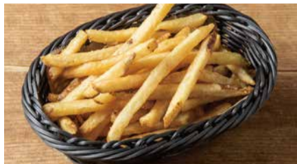
フレンチフライ 680 French Fries [税込価格748]