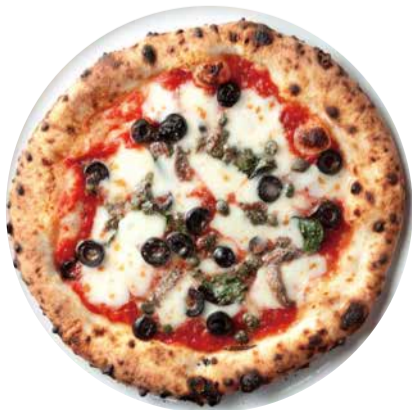
ロマーナ Pizza Romana トマトソース/オレガノ/グラナパダーノ/バジル/ オリーブ/ケッパー/アンチョビ/乳牛モッツアレラ 1400 [税込価格1540]