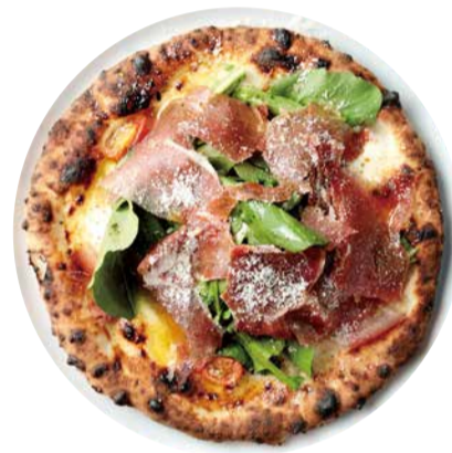
プロシュート エルッコラ Pizza Prosciutto & Rucola ルッコラの上にたっぷりの生ハムで サラダ感覚! 1800 [税込価格1980]