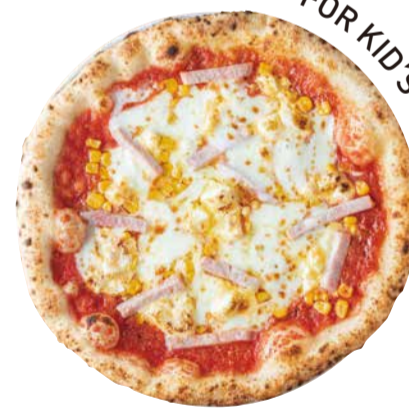
バンビーノ Pizza Bambino お子様から大人まで楽しめるハム、コーンのピッツア マヨネーズがアクセント 1450 [税込価格1595]