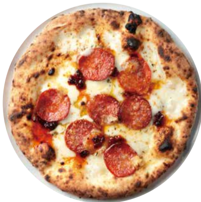
ディアボラ Pizza Diavola 辛みの効いた ピカンテサラミのピッツア 1580 [税込価格1738]