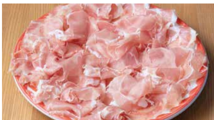
こぼれ生ハム 1000 A Large Serving Raw Ham [税込価格1100] 切り立ての生ハムをこぼれるくらいたっぷり!