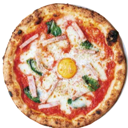
ビスマルク Pizza Bismarck マルゲリータをベースにプロシュートコット、 半熟卵をトッピング 1500 [税込価格1650]