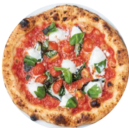
水牛モッツアレラチーズのマルゲリータ Pizza Margherita D.O.C 水牛モッツアレラでミルクィな味わい 1800 [税込価格1980]