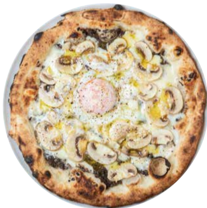
リッチトリュフ Tacos Salsa Pizza 豊かなトリュフの香りと半熟卵の 贅沢な組み合わせ 1800 [税込価格1980]