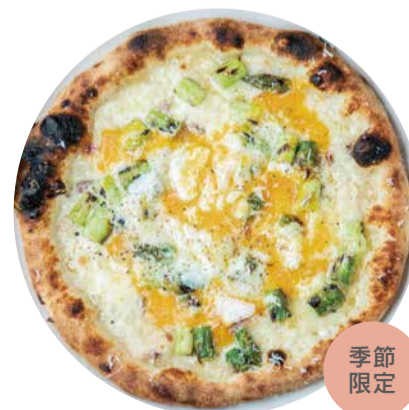
グリルアスパラと半熟卵のクリームソースピッツア Asparagus & Half Boiled Egg Cream Pizza アスパラの美味しさを 最大限に引き出したピッツア 1800 [税込価格1980]