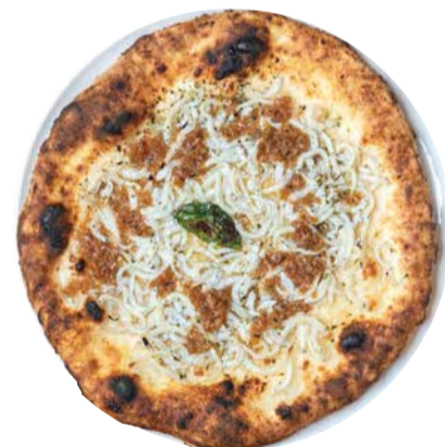
シラスのピアンケッティ Bianchetti チーズベースのピッツアに シラスと香味オイル 1600 [税込価格1760]