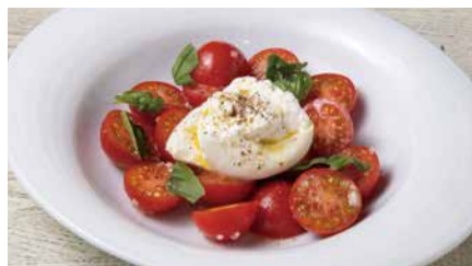
北海道モッツアレラとミニトマトのカプレーゼ 980 Caprese Salad [税込価格1078]