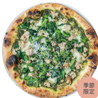
サルシッチャ、春野菜のジェノベーゼピッツア Genovese Pizza with Salsiccia & Vegetables 沖縄産バジルを使用したジェノベーゼと 自家製サルシッチャ、春野菜のピッツア 1900 [税込価格2090]