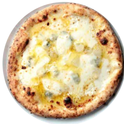
クアトロフォルマッジ Pizza Quattro Formaggi 4種のチーズのピッツアは 蜂蜜をかけて 1800 [税込価格1980]