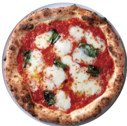
マルゲリータ Pizza Margherita ピッツアの王道と言えばやっぱりマルゲリータ! 何にするか迷ったらこれで決まり!! 1380 [税込価格1518]